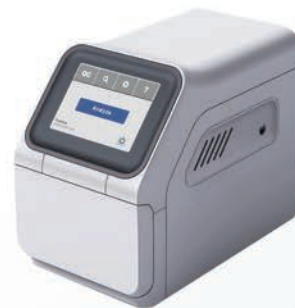
MNCHIP POINTCARE V2 Autoanalizador compacto de bioquímica Rotores con perfiles de hasta 14 parámetros 100 µl de sangre total