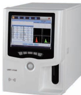
URIT 5160 Analizador automático de hematología Tecnología de citometría láser 28 parámetros 5 poblaciones