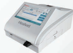
FIA HEALVET Analizador de inmunofluorescencia Cartuchos monotest T4, TSH, Progesterona, Cortisol, PCR, HbA1c